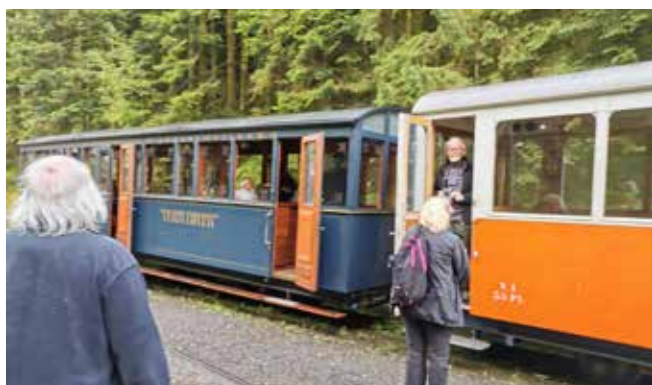
3 août 2023 Randonnée Donon et train touristique forestier Abreschviller