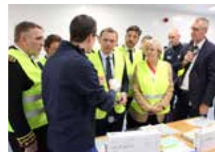
Découverte de la ligne de production de pansements