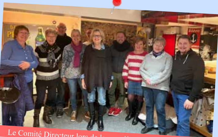
Le Comité Directeur lors de la première réunion après l'AG

Le bureau du CCLR s'est réuni 6 fois en 2023. L'ordre du jour des réunions s'est porté principalement sur l'organisation, le bilan financier et le débriefing des différentes manifestations.