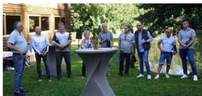
Les membres et anciens membres récompensés en compagnie du Maire