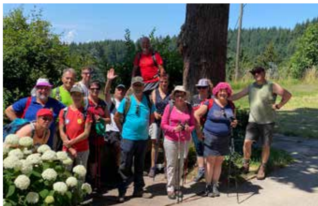
8 juillet 2023 Randonnée fontaines à schnaps Forêt noire