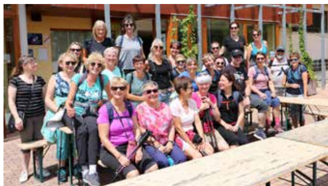
1 er et 2 juillet 2023 : Stage à la Maison du Kleebach dans les Vosges

Le succès du stage permet à l'association Petits Pas d'envisager de reconduire la manifestation en juillet 2024.