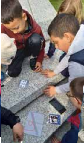
Travailler en équipe...