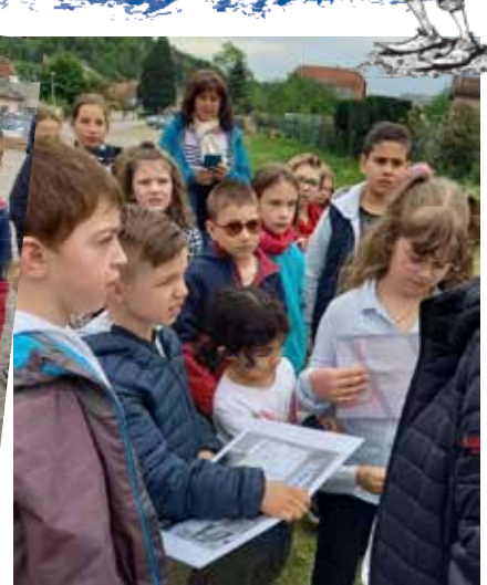
Écouter et analyser...

Nos recherches nous ont menés de la rue de la Gare, à la rue des Grands Jardins, à la rue Clémenceau jusqu'à la rue du Hoimbach.