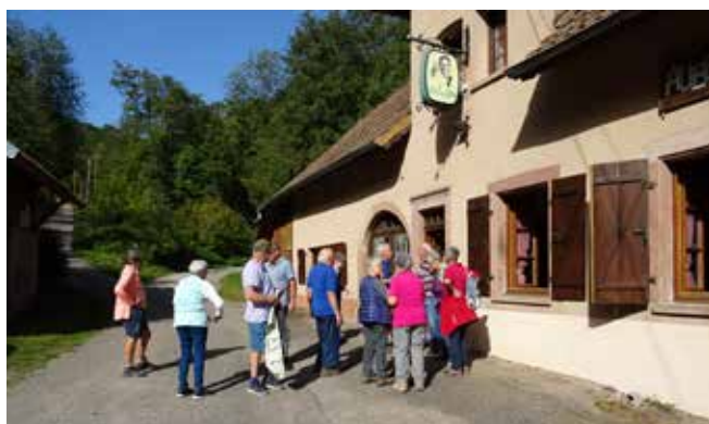
8 octobre 2023 Randonnée du vin nouveau sur les hauteurs de la Hingrie