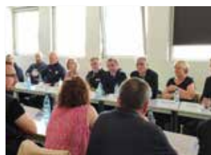
Table-ronde avec le Ministre, les collaborateurs HARTMANN France et les autres invités