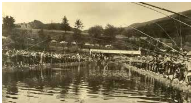
Concours de pêche à l'étang de Rombach

La buvette fonctionnait sans cesse, une licence de débit de boissons ayant été acquise en 1969.