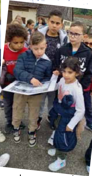
Lire un plan, se concerter...